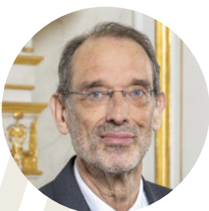
Bundesminister Univ.-Prof. Dr. Heinz Faßmann

Mit dem 8-Punkte-Plan für die Digitale Schule setzen wir die größte Investition um, die es im digitalen Bildungsbereich jemals gegeben hat.